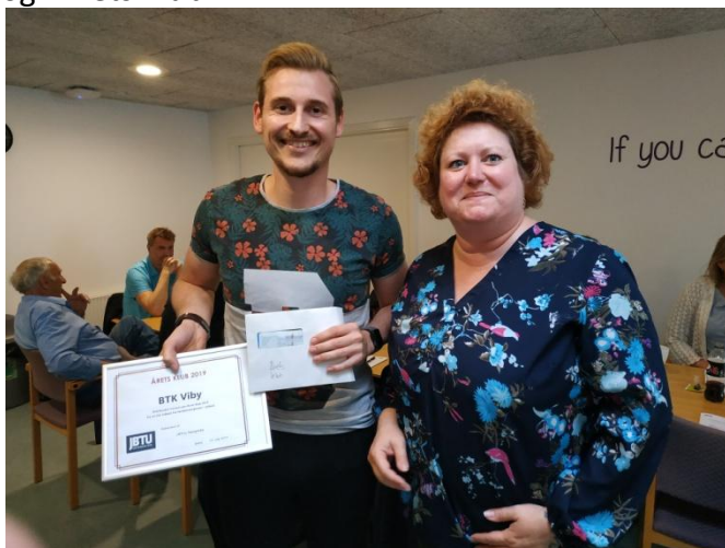
Årets Klub. BTK Vibby

Dirigenten suspendede herefter repræsentantskabsmødet til kåring af "Årets Jyske leder" og "Årets Klub".